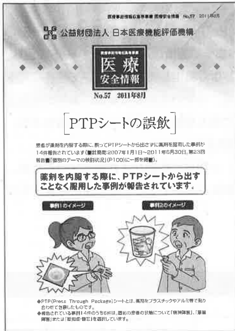
図表Ⅳ-1-2 医療安全情報No.57「PTPシートの誤飲」